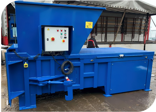
VSP 50 LR мусороперегрузочный пресс