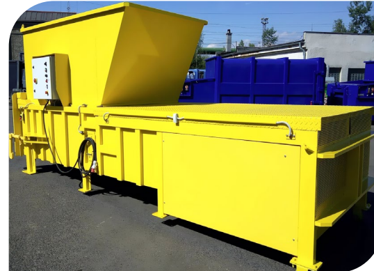
VSP 50 MAX LR мусороперегрузочный пресс