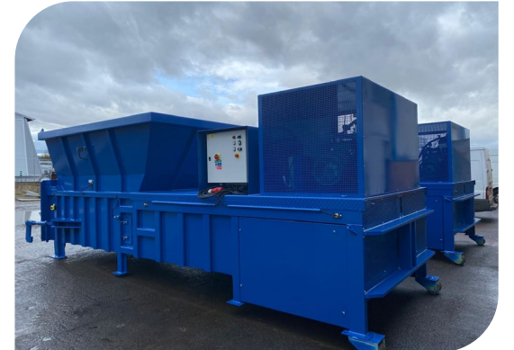
VSP 50 S MAX LR мусороперегрузочный пресс