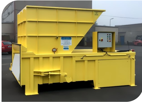
VSP 50 S LR мусороперегрузочный пресс