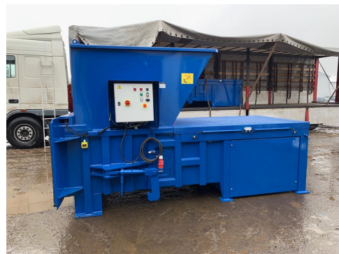
Мусороперегрузочный пресс VSP 50 LR