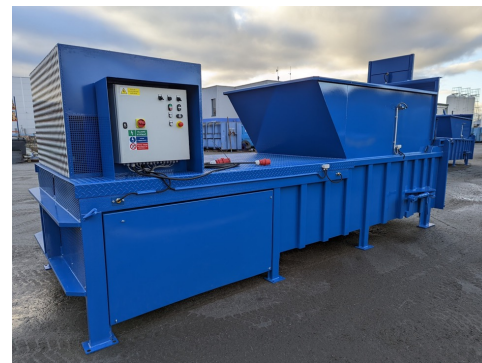
Мусороперегрузочный пресс VSP 50 MAX LR