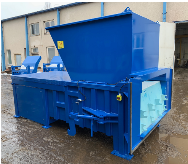
ФОТО СТАЦИОНАРНЫЙ ПРЕСС VSP 50