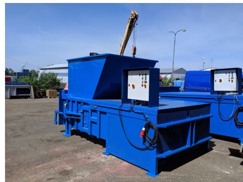
Мусороперегрузочный пресс VSP 50 S LR