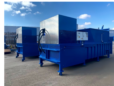
Мусороперегрузочный пресс VSP 50 S MAX LR